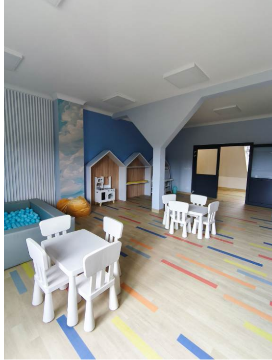
Sala zajęć animacyjnych dla dzieci