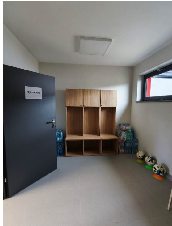
Wieszaki w szatni przy wejściu do budynku oraz szatnia sędziów