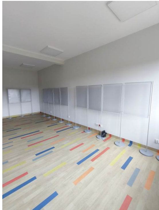
Wieszaki przed salą do zajęć animacyjnych oraz stojaki na rysunki